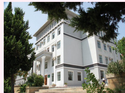
Azərbaycan Tibb Universitetinin Onkoloji Klinikası yaradılıb.

Azərbaycan Respublikasının Prezidenti cənab İlham Əliyevin Sərəncamı əsasında Nazirlər Kabinetinin 23 noyabr 2006-cı il tarixli 250 sayılı qərarı ilə