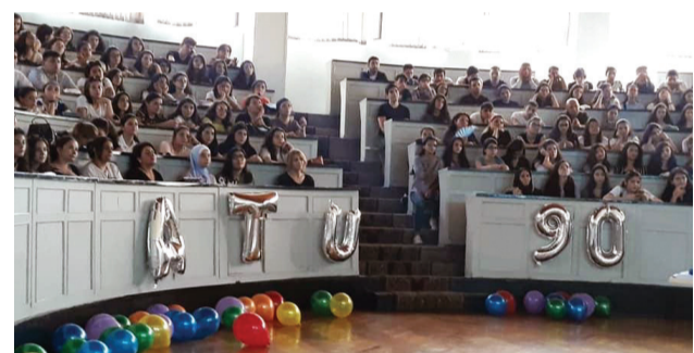
elektron və adi kitabxana, oxu zalları və tələbə yeməxanaları haqqında ətraflı məlumat verilib.

Sonda tələbələrə TGT-nin əməkdaşları tərəfindən bütün tədris korpusları və tədris klinikaları, tədris olunacaq fənlər,