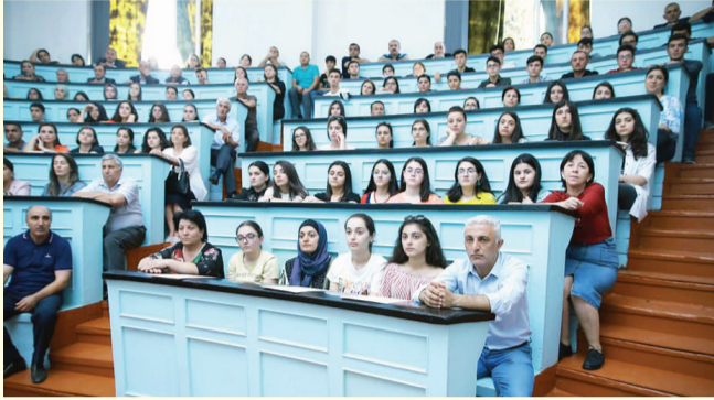
I müalicə-profilaktika fakültəsi

Bu görüşlər sentyabrın 13-də Əczaçılıq, sentyabrın 14-də isə I və II Müalicə, İctimai səhiyyə, Stomatologiya fakültələrində baş tutub.