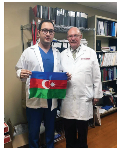
Amerikan Paradontologiya Təşkilatının ömürlük fəxri üzvüdür.